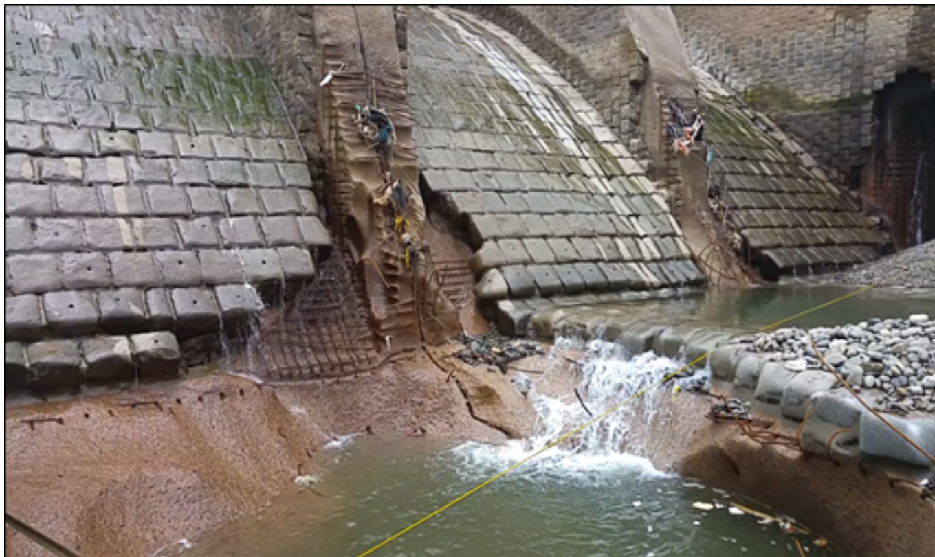
Daños en la Bocatoma de la planta de agua potable de Huachipa

Todos estos elementos deberían ser suficientes para que las autoridades puedan plantear a la población, cambios sustanciales en la estructura de gestión de las empresas, pero los mitos, los paradigmas anti empresa privada y una patética escala de valores, donde se privilegia la política antes que la oferta de un servicio social básico, lo siguen impidiendo.