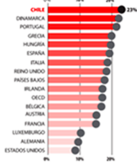
Porcentaje de hijos de padres del 25% de menores recursos que logra llegar al 25% de mayores recursos