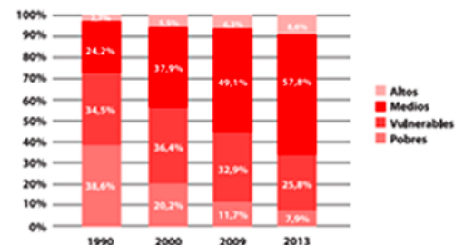
Porcentaje de personas por estrato social