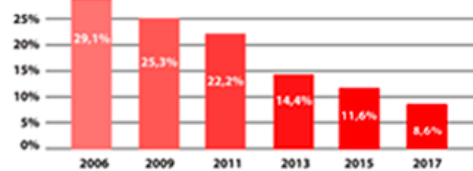
Porcentaje de chilenos en situación de pobreza