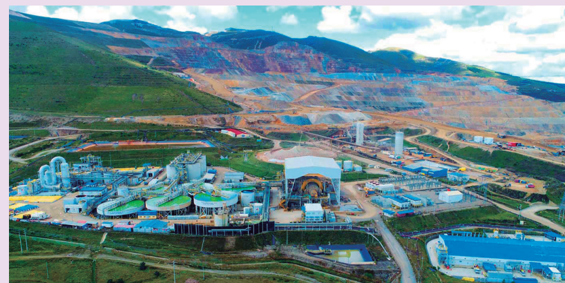
Instalaciones de la mina Yanacocha, que fue uno de los más grandes productores de oro del mundo

Desde la experiencia de Gold Fields, el ejecutivo refiere que superar esta situación requiere más que anuncios de inversión. “Es indispensable fortalecer el diálogo temprano y permanente, cumplir de manera estricta los compromisos ambientales y sociales, y asegurar que los beneficios de la actividad minera se traduzcan en mejoras concretas para las comunidades. Solo a través de confianza, la predictibilidad y una agenda compartida de desarrollo territorial será posible destrabar inversiones y avanzar hacia una minería que conviva de forma sostenible con Cajamarca”, señala el experto. Al respecto, el MINEM coincide en que la falta de consensos sostenidos