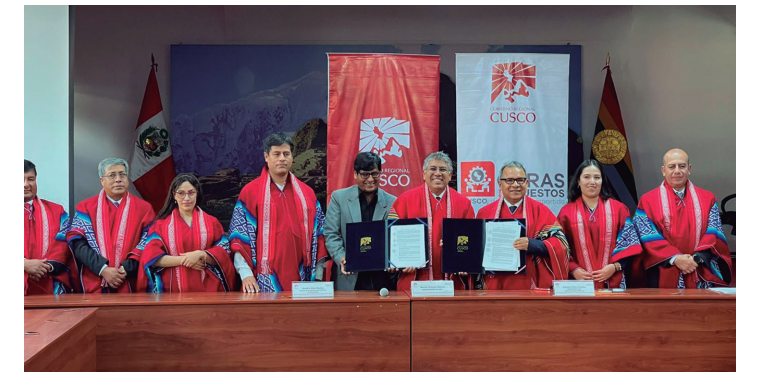
Antapaccay y Gobierno Regional del Cusco firmaron importante convenio