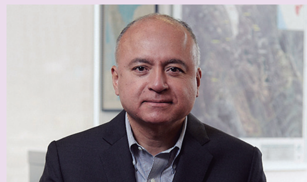
Victor Gobitz presidente de la SNMPE

capital inicial del proyecto baja. Además, todos los proyectos que están en Cajamarca están bien estudiados, pero no tienen leyes de cobre altas, todos están por debajo del 0.8% y enfrentan CAPEX muy altos. Una estrategia es buscar sinergia entre ellas”, refiere Gobitz.