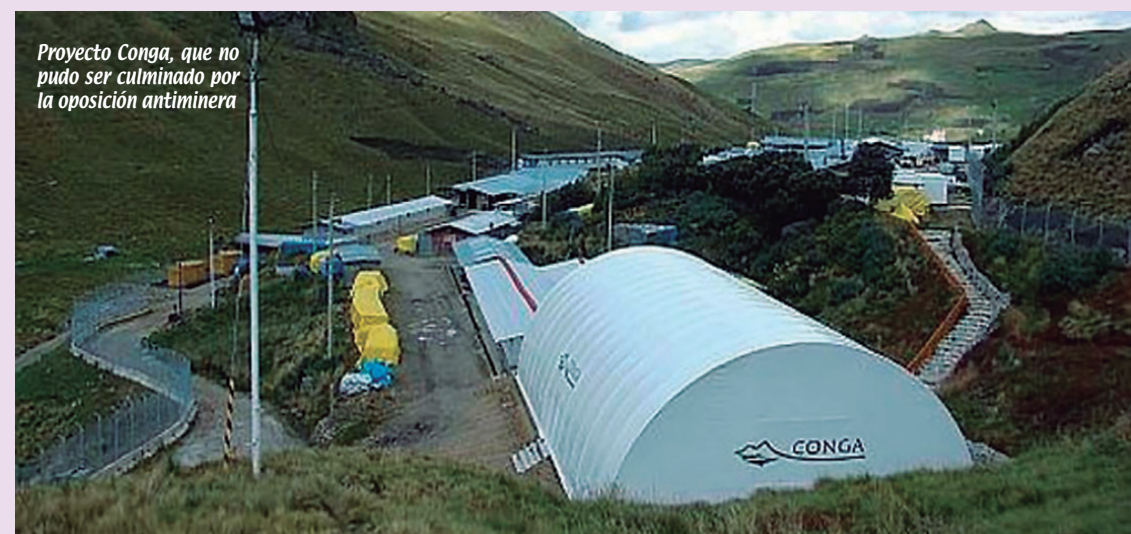
Proyecto Conga, que no pudo ser culminado por la oposición antiminera