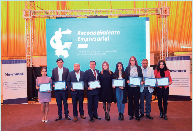
Representantes de las empresas que tuvieron reconocimiento empresarial

En el marco de la transición hacia un cierre de mina responsable, Cabanillas hizo un llamado a fortalecer la plataforma «multiactor». El directivo enfatizó que es necesario el trabajo articulado entre el gobierno, la academia y la empresa privada para atender temas urgentes como el acceso a agua segura y la reducción de las