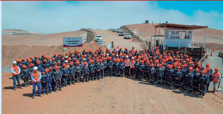
Personal que trabaja en el proyecto Tía María

Es un proyecto que está en evaluación, tiene algunos informes que tienen que aprobarse en el ministerio, pero está en camino. Estamos dando prioridad al destrabe, pero eso no significa que vamos a dejar otros proyectos de lado. Zafranal