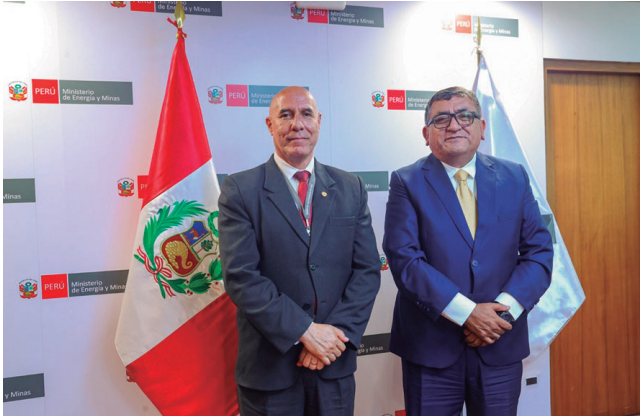
Rodolfo García Esquerre, Alto Comisionado para el combate de la minería ilegal y el ministro de Energía y Minas, Luis Bravo de la Cruz

Asimismo, la modificación del Código Penal (artículos 307A, 307E, 307F y 307G) que aumenta las penas y multas a quienes realicen minería ilegal o financien, trasladen, acopien