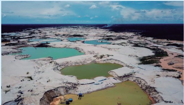
Minería ilegal en la zona de La Pampa cerca de Madre de Dios

Yo creo que el destrabe y la inversión tienen que darse no solamente porque Tía María inicie operaciones. Sino porque eso va a ayudar a entender cómo la minería apoya al desarrollo del país. Prácticamente no hay actividad en el país que no tenga relación con la minería. No olvidemos que la minería ha cerrado el 2025 con más con 50,000 millones de dólares en exportación, ¿tú crees que la minería no tiene incidencia en el tema educativo, no tiene incidencia en el tema agrícola, en el tema de salud? Gracias a esas exportaciones es que nosotros podemos hacer desarrollo de infraestructura, desarrollo territorial y desarrollo no solamente de las comunidades, sino también desarrollo del país. O sea, la minería está dentro de nuestro futuro directa o indirectamente.