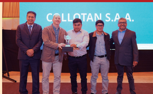
Representantes de Collotán con el trofeo ganado

El directivo subrayó que este tipo de incentivos por parte de la empresa privada son fundamentales para motivar a las empresas locales a seguir trabajando de manera conjunta por el desarrollo de sus comunidades. Finalmente, envió un mensaje a los emprendedores que comienzan en el rubro, señalando que el compromiso, la responsa-