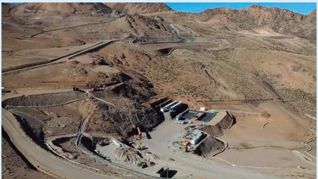
Proyecto minero San Gabriel que está por entrar en producción