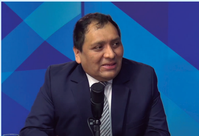
Viceministro de Minas Carlos Talavera Flores durante la entrevista

¿Cómo ha incidido el precio internacional en el caso del cobre y el oro en estas cifras que usted menciona?