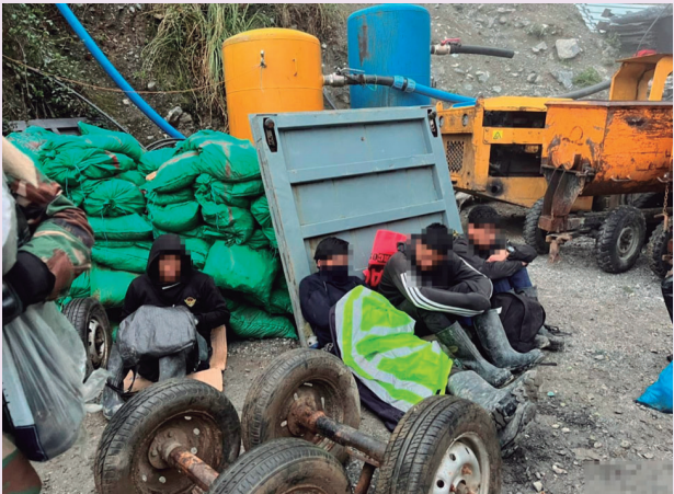
El Comando Unificado Pataz, ya ha tenido más de una operación exitosa

Los detenidos y el material incautado fueron puestos a disposición de la autoridad policial competente para las