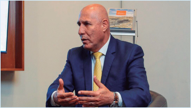
General Rodolfo García Esquerre, Alto Comisionado para la lucha contra la minería ilegal

Nosotros tenemos el firme propósito de eso y no solamente eso, también tenemos el encargo del señor ministro de presentar a este congreso una nueva ley MAPE. La cual ya la estamos desarrollando actualmente con el equipo.