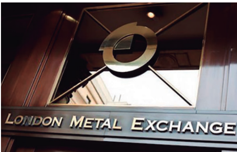
Bolsa de Metales de Londres

En tanto, Huiman consideró que el precio del oro podría sostenerse en el corto y mediano plazo. En el caso de los metales industriales, como el cobre, la demanda estará más ligada al ciclo económico, aunque los déficits estructurales de oferta y la transi-