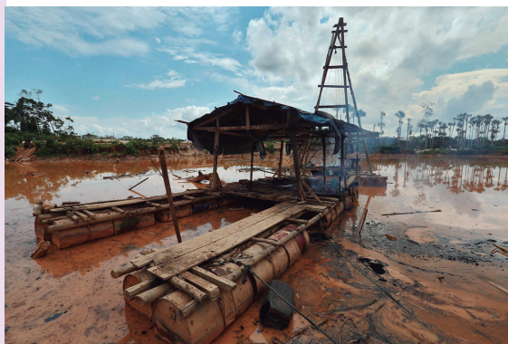
La minería ilegal usa el Reinfo como un camuflaje legal, ya han advertido distintos analistas y expertos del sector.

Al final lo que recibió luz verde fue la extensión hasta finales del próximo año, tal como lo había mencionado el presidente de la República, José Jerí, quien se mostró en contra de ampliarlo hasta el 2027, pero consideró que solo un año más era “razonable”.