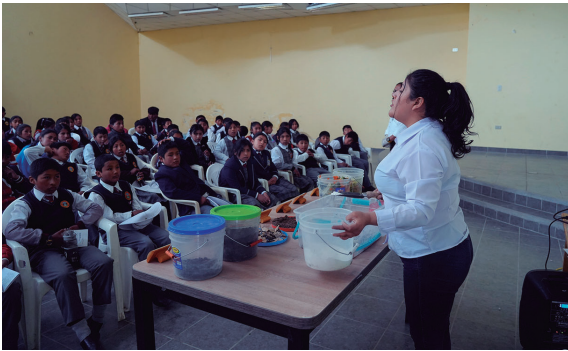
Antapaccay, talleres sobre medio ambiente

Con esta edición, Antapaccay reafirma su compromiso a la formación de generaciones más conscientes y preparadas para enfrentar los desafíos ambientales.