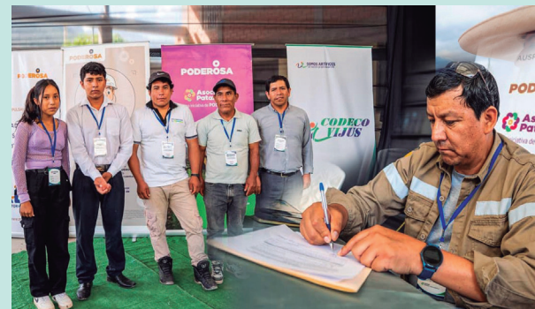
Ganadores de los proyectos de obras comunales recibirán el financiamiento para su ejecución

El tercer proyecto ganador fue la “Ampliación del sistema de alcantarillado en el anexo Campamento”, una obra que apunta a mejorar el saneamiento básico y reducir riesgos sanitarios. Cada iniciativa recibirá hasta S/130 mil en financiamiento, con fondos provenientes de Asociación Pataz y aportes complementarios de la Municipalidad Distrital de Pataz, empresarios locales y las comunidades.