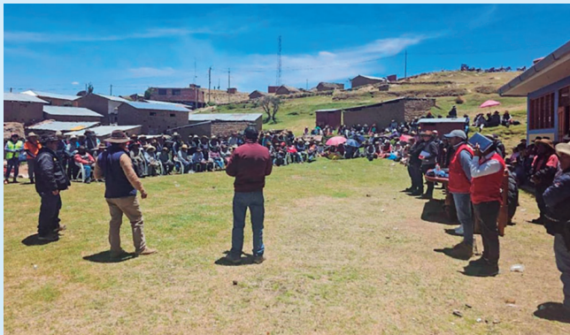
Habitantes de la comunidad de Tuntuma que estuvieron muy interesados en los resultados del diálogo

La OGGS señaló la importancia de mantener espacios de diálogo permanentes y transparentes, que fortalezcan la articulación entre las comunidades, autoridades y empresas privadas del sector minero, para consolidar relaciones de confianza, asegurar consensos y promover soluciones que permitan atender las necesidades de la población.