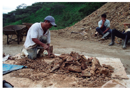
Reinfo se extenderá hasta finales del 2026: Congreso dio luz verde

Con esto en mente, lo que planteaba entonces esta disposición complementaria transitoria era que, mediante decreto supremo, el Minem establezca “criterios técnicos y objetivos, así como el procedimiento para la evaluación de los reclamos, solicitudes