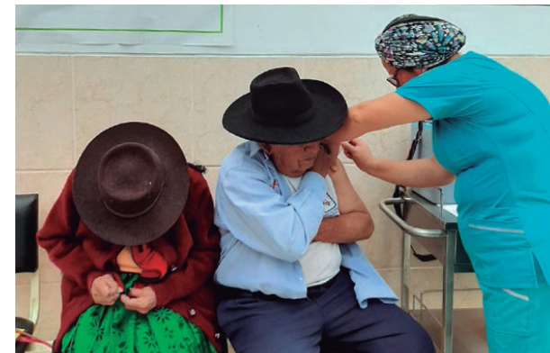
Las Campañas médicas lograron atender a 8,771 personas