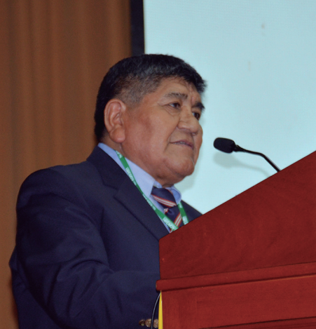
Ministro Rómulo Mucho dando su discurso de clausura