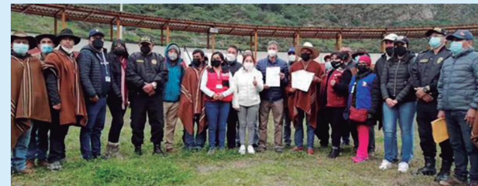
Se fortalecerá el uso de internet en la zona

Entre los acuerdos, producto del diálogo realizado el pasado 20 de abril, se definió la instalación de una oficina de Gestión Social de Antamina en Aquia, la elaboración de un expediente y construcción