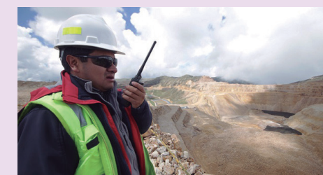
Las regiones de la Macrorregión Centro concentran la mayor inversión en proyectos de exploración minera

Las regiones de la Macrorregión Centro concentran la mayor inversión en proyectos de exploración minera y representan el 43.8% del total con 34 proyectos por un monto ascendente a US$ 282 millones, según la Cartera de Proyectos de Exploración Minera 2024, presentada por el Ministerio de Energía y Minas (MINEM), que comprende 75 proyectos ubicados en 17 departamentos del país.