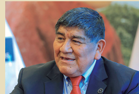
Rómulo Mucho, ministro de Energía y Minas

Comentó que en los últimos tiempos se ha venido desarrollando una falsa narrativa hecha para generar discordia y tratar de instalar la idea de que la minería pone en peligro a la agricultura o no es sostenible como otras actividades humanas.