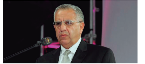
Abraham Chahuán, Presidente del IIMP

Finalmente, Chahuán manifestó que los S/ 123 mil millones no recaudados por proyectos habrían cubierto la brecha de infraestructura de corto plazo, equivalente a S/ 117 mil millones.