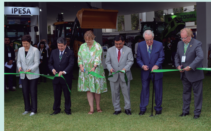
Personalidades cortando la cinta en la feria de AGROMIN