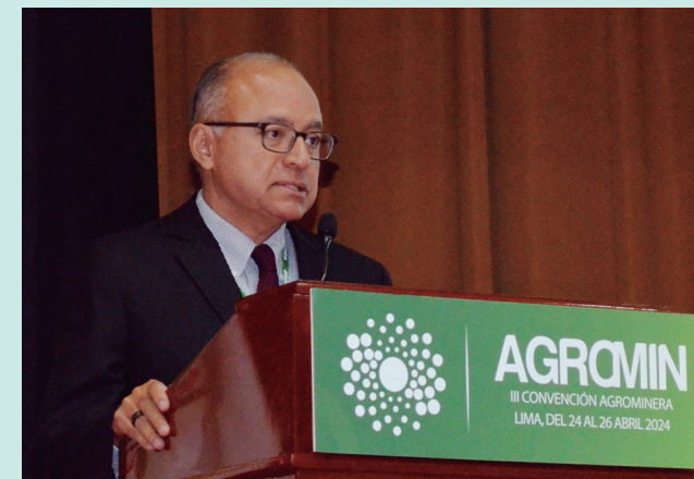
Victor Gobitz presidente de la SNMPE

diferentes aspectos comunes y transversales a la agricultura y la minería. “Entre ellos tenemos a la gestión del agua; el desarrollo territorial; el impacto económico y potencialidad futura de ambas actividades; la necesidad de operar con principios de sostenibilidad, y el potencial del país con los minerales críticos y las nuevas tecnologías, en el contexto del cambio de matriz energética en el mundo”, remarcó.