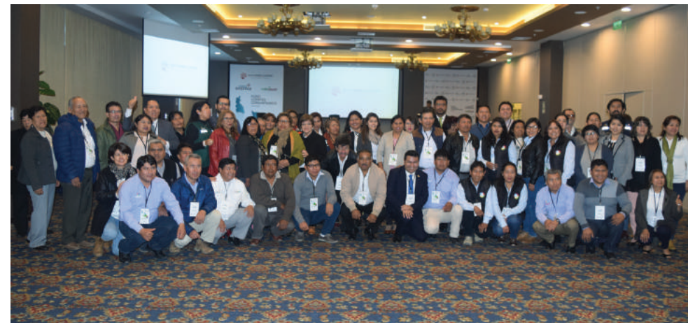
Líderes comunitarios del área de influencia de Southern, que participaron en el Foro de Comités Comunitarios