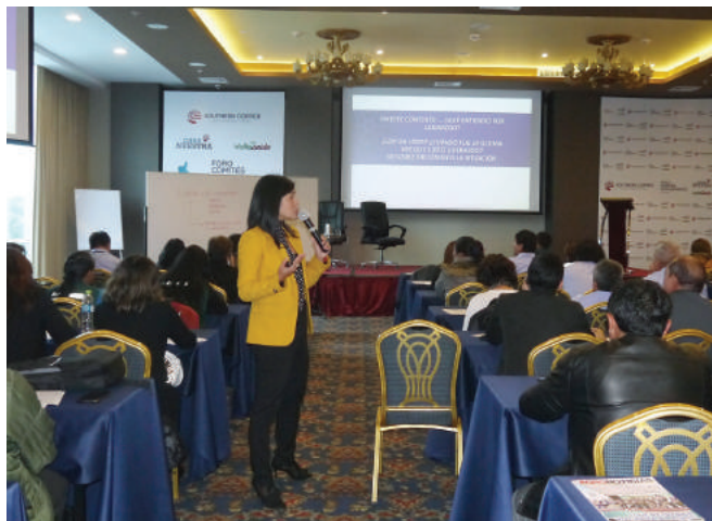
Los líderes comunitarios analizaron la forma de ejercer liderazgo en beneficio de sus comunidades

Minas y Petróleo acudió a este encuentro donde agricultores, productores, campesinos, profesionales, se reunieron para debatir, exponer las inquietudes y anhelos de sus comunidades así como participar de dinámicas y talleres de