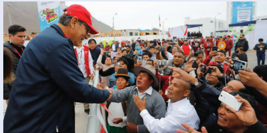
Presidente Vizcarra en una de sus visitas al sur del Perú

El presidente Martín Vizcarra espera que pronto se instale una mesa de diálogo entre el Gobierno y las autoridades de Arequipa para analizar la problemática del Valle del Tambo, área de influencia directa del proyecto minero Tía María