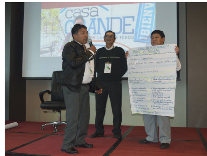
Los líderes de Punta de Bombón, muestran cuales son los objetivos que esperan alcanzar para su comunidad