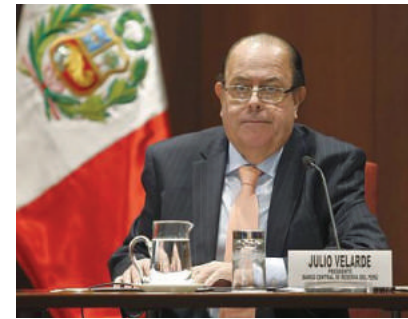
Presidente del BCR, Julio Velarde

El presidente del Banco Central de Reserva (BCR), Julio Velarde, sostuvo el 3 de julio que el proyecto minero Tía María debería aprobarse, pues la empresa a cargo cumplió con todos los requerimientos ambientales que se le requirió. “Los recursos que contribuyen al bienestar de todos los peruanos deben explotarse y (considero que) Tía María debe ejecutarse al cumplir los requisitos para la licencia”, declaró luego de presentar la novena moneda de la Serie Numismática “Fauna Silvestre Amenazada del Perú” alusiva al gato andino. Sin embargo, afirmó que el proyecto Tía María debe iniciarse luego que se obtenga la licencia social de las zonas involucradas.