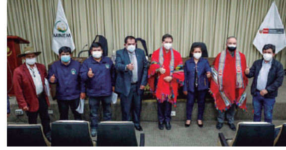
El Ministro de Energía y Minas, Jaime Gálvez Delgado reunió con las autoridades de la provincia de Grau en Apurímac

El ministro de Energía y Minas, Jaime Gálvez Delgado reunió con las autoridades de la provincia de Grau en Apurímac