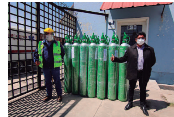
El aprovisionamiento de oxígeno para satisfacer las necesidades de los pacientes con Covid-19, ha sido una importante contribución de las empresas mineras, entre ellas Minera Antapaccay