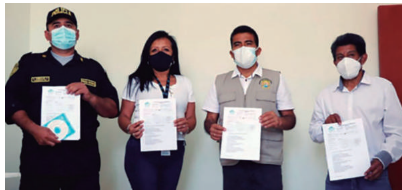
Las obras se llevaron a cabo bajo estrictos controles sanitarios y protocolos de bioseguridad

La comisaría y el puesto de carreteras de la Policía Nacional del Perú en Huarmey cuentan, desde ahora, con una renovada infraestructura que apoya el desempeño de su importante labor. Los nuevos ambientes con mejor calidad de habitabilidad permitirán albergar al personal policial de ambas divisiones. También se renovaron los servicios higiénicos y los cafetines. Estas mejoras se lograron gracias al compromiso asumido por Antamina a través de la UGT Huarmey y la Municipalidad de Huarmey.