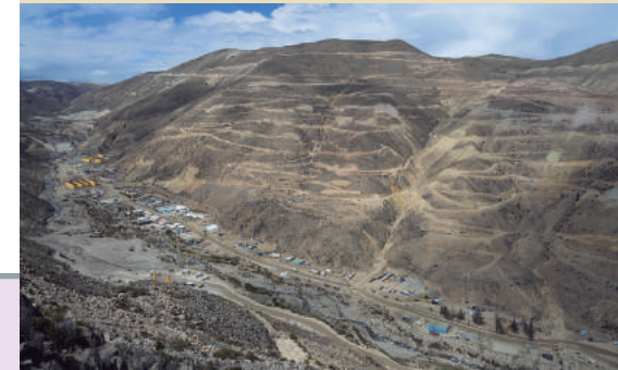
A Anglo American Quellaveco S.A. le correspondió más de la cuarta parte de inversiones mineras del primer trimestre del año

Las operaciones mineras en el Perú han completado inversiones por US$ 943 millones en los primeros tres meses de 2021, con variaciones positivas en los rubros de exploración y otros al comparar las cifras de marzo con las del mismo mes de 2020, según registra el Boletín Estadístico Minero (BEM) del Ministerio de Energía y Minas (Minem).