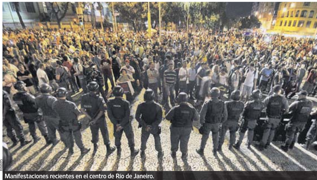
Manifestaciones recientes en el centro de Río de Janeiro.

El giro no podría ser más pronunciado para estos países, cuyo crecimiento ayudó a compensar la debilidad de Estados Unidos y Europa durante la crisis financiera. En su búsqueda por obtener retornos más altos, los inversionistas privilegiaron las economías emergentes