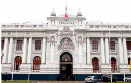
Congreso en Descanso

Nublados por la política y lejos de la realidad