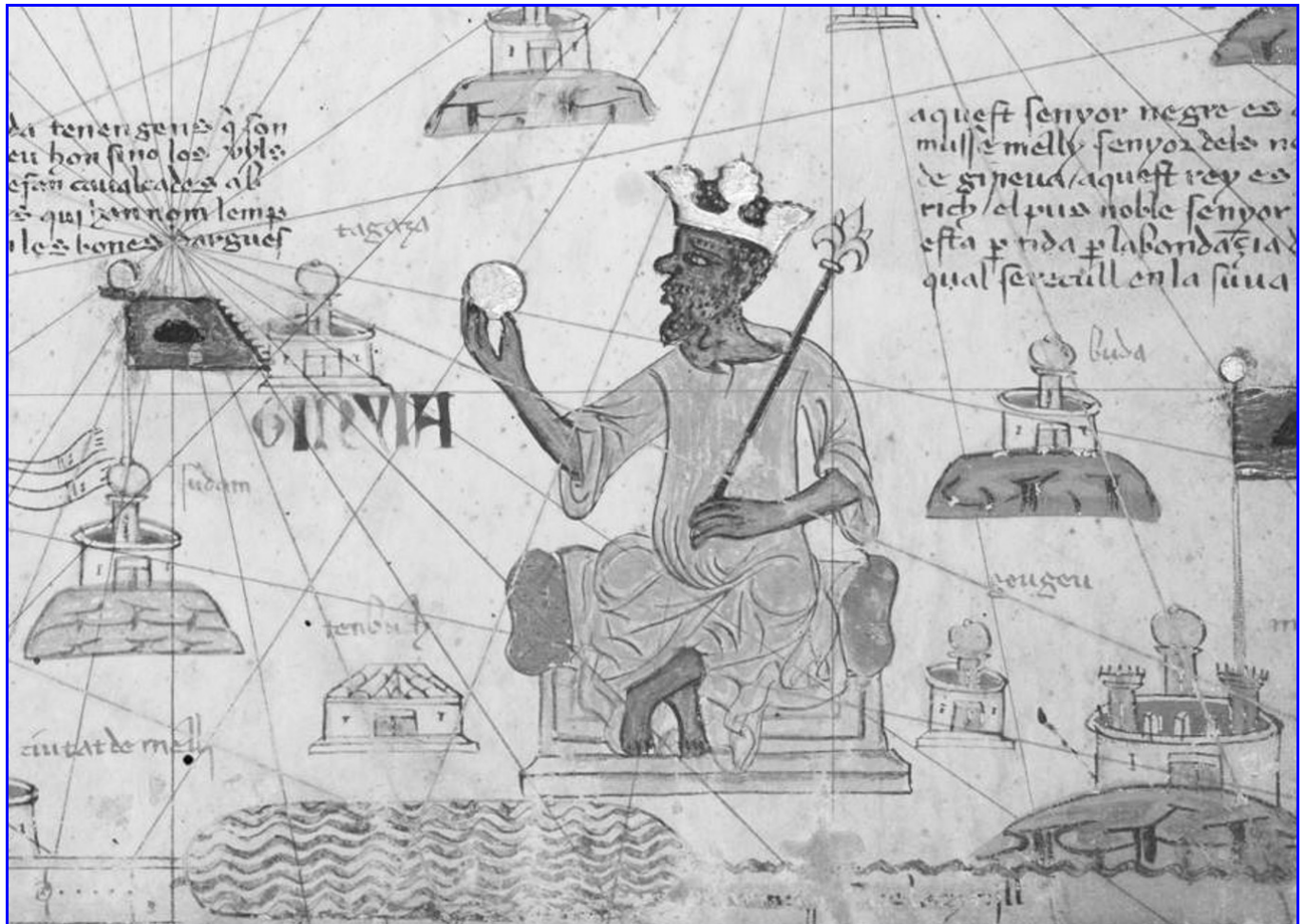
Iconografía del 'rey de reyes', Mansa Musa I, hijo del Emperador Abubakari Keita II de Mali, África.

Después de recalcar que las posesiones materiales, como el oro, nunca han sido una medida de la riqueza de las naciones, XSiM nos recuerda la frase de Adam Smith, "Nadie ha visto jamás a un perro cambiando voluntariamente un hueso con otro perro" para concluir que: "La capacidad de intercambiar bienes y servicios con otros miembros de la especie acabó siendo uno de los cimientos del progreso económico de la sociedad." A partir de esta capacidad desarrollada hace cien mil años, surgen la división del trabajo y la especialización que han permitido a la raza humana aumentar su productividad y por lo tanto ser más ricos.