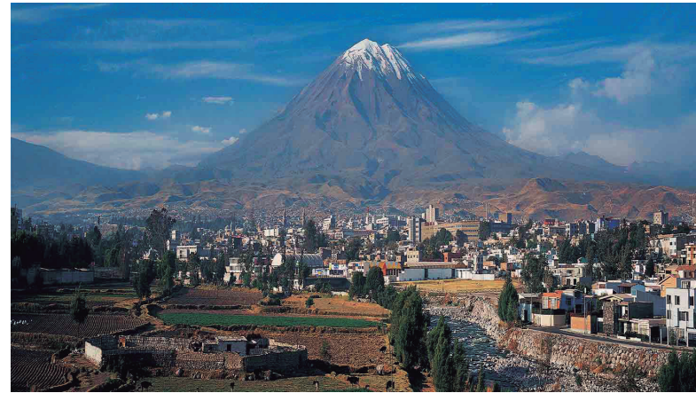
Vista panorámica de la ciudad de Arequipa, que ha sabido llegar a convenios mutuamente convenientes con la Minería

Después de 8 años y con una inversión de US$5,320 millones, el pasado 23 de mayo, se inauguró la expansión de Cerro Verde. Dieciocho mil trabajadores que pusieron el hombro, sin parar, en su etapa de construcción, consiguieron que la mina se convirtiera en la mayor operación cuprífera del Perú, una de las cuatro más grandes del mundo y en modelo de la minería de clase mundial, logrando que el plan de expansión de la Unidad Productiva de Cerro Verde, que previamente había sido calificado -según Resolución Ministerial Nro. 541-2014-MEM/IM- de interés nacional, se ejecute a plenitud.