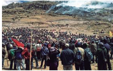
Los convenios han sido de gran utilidad para controlar las protestas. Desactivarlos exigirá su sustitución por algún otro sistema con el mismo fin

Tras protestas en Las Bambas que dejaron un campesino muerto y varios policías heridos, dos de ellos de gravedad, la agencia Reuters informó que el Gobierno peruano revisará los convenios entre la policía y las empresas mineras.