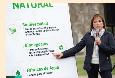
Ministra del Ambiente, Elsa Galarza

La ministra del Ambiente, Elsa Galarza, sostuvo el 28 de octubre que la población que vive en las comunidades cercanas a la mina de Las Bambas, "se ha abierto al diálogo".