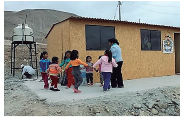
Vista de una vivienda con un tanque de agua recién instalado

instituciones educativas atendidas que carecen del servicio de agua potable, el programa les proveerá con carros cisternas el recurso hídrico para que los niños puedan lavarse las manos y usar los servicios higiénicos. A inicios de año el programa Apoyo a la Educación entregó buzos a los escolares del valle de Tambo y desarrolló las vacaciones útiles para los niños de la zona, también implementó el Aula de