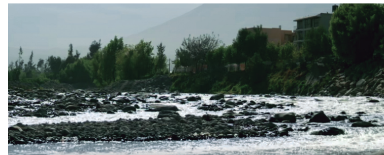
El exceso de agua tratada que no se utilice para operaciones de Cerro Verde, se devolverá al río Chili cumpliendo los estándares de calidad de efluentes

Este es el caso de Sociedad Minera Cerro Verde, en Arequipa, región que a pesar de contar con siete represas -que se alimentan de las aguas del río Chili- solo utiliza el 60% de los 400 millones de metros cúbicos que se almacenan en época de lluvias,