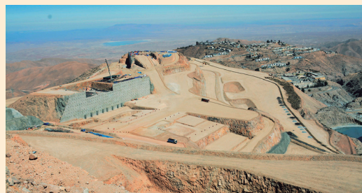
Los trabajos para la ampliación de Toquepala avanzan sin contratiempos

Las construcciones de las obras civiles y el montaje de estructuras se contemplan concluir a mediados del mes de febrero del 2017 para cerrar la segunda etapa del proyecto y de esta forma continuar