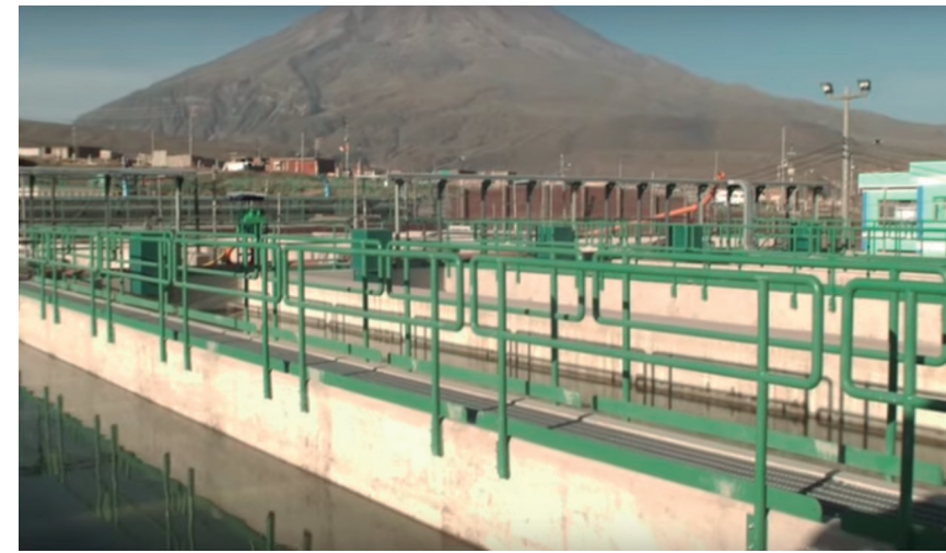
Planta de tratamiento de La Tomilla II construida en el distrito de Cayma, que dotará de agua potable a Arequipa

mejora de la primera concentradora, reubicación y/o modificación de las instalaciones, se indica en la memoria anual.