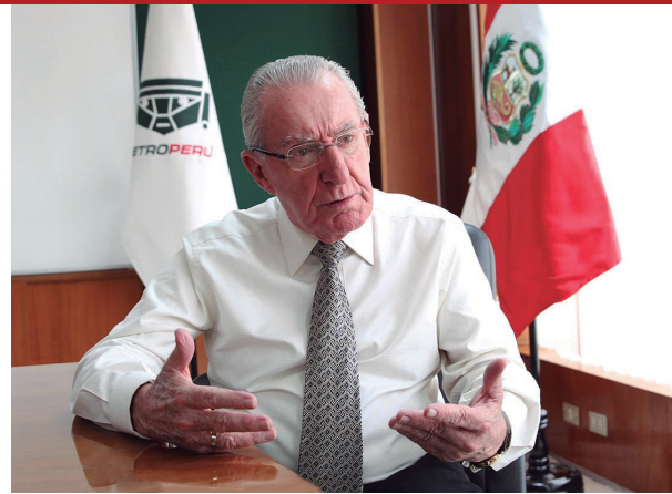
Augusto Baertl Montori, presidente de Petroperú

En ese sentido, Baertl Montori insistió en la necesidad de contar con protección necesaria, como drones y satélites, para salvaguardar esta infraestructura de interés nacional. “Es importante también el apoyo de las fuerzas del orden para que protejan el Oleoducto en las zonas aledañas al Marañón”, señaló al tiempo de aclarar que las fugas de crudo han sido contenidas y el riesgo de contaminación por hidrocarburos ha sido