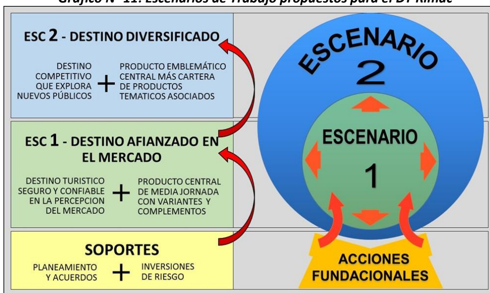
Grafico N° 11: Escenarios de Trabajo propuestos para el DT Rímac