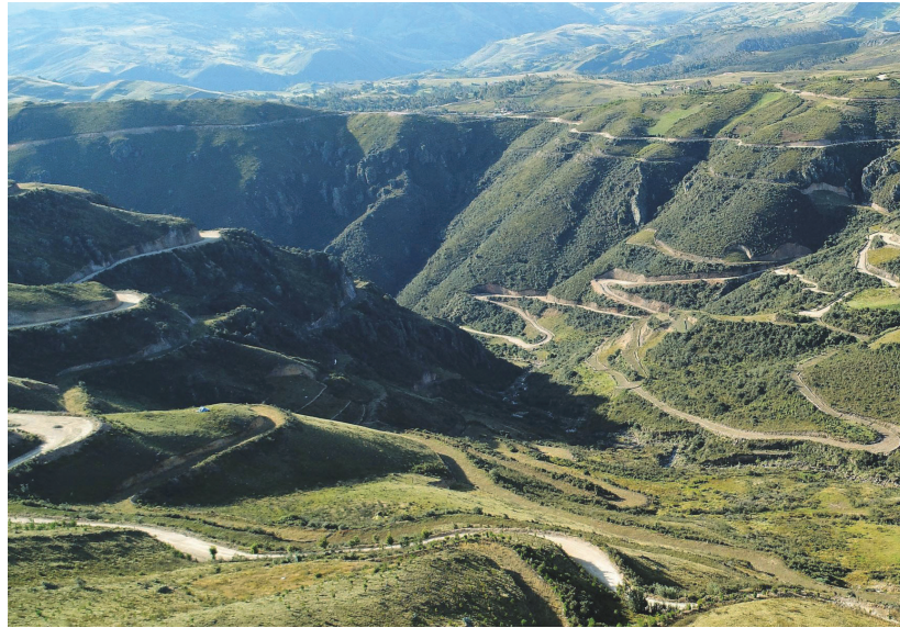
Vista panorámica del yacimiento de Michiquillay

¿Qué comentarios podría hacer usted sobre la política de inversiones de Southern?