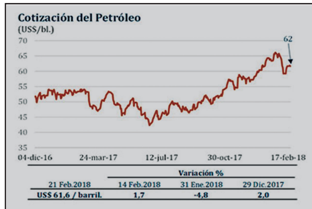
Fuente: BCRP, Nota Semanal No. 7, febrero 23, 2018