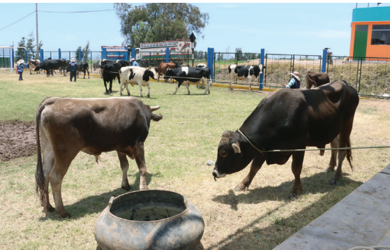
Toros de engorde donados por Southern que generan un aporte de capital para los productores de Ite