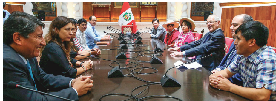
La reunión del Presidente de la República con los líderes de las comunidades del entorno de Michiquillay genera muchas esperanzas de que el proyecto se pueda culminar en 5 años