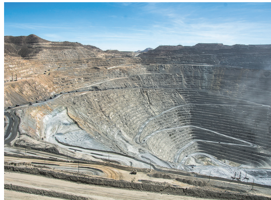
Vista del tajo de Toquepala cuya producción anual de cobre se incrementará en 100 mil toneladas

Paralelamente, seguimos empeñados en sacar adelante nuestro proyecto de