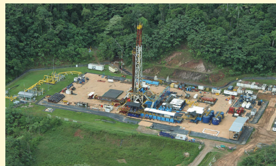
Osinergmin investiga las causas del derrame de petróleo para determinar responsabilidades (FOTO Andina).

"La idea es lograr que entren las denominadas majors, y si se está conversando, por medio de otras empresas se han acercado al ministerio", señaló. Así lo señaló durante el seminario "Minería y Energía", organizado por la Sociedad de Comercio Exterior del Perú (Comex Perú).