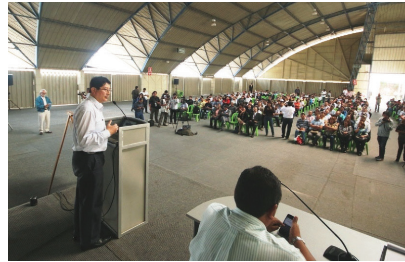
Audiencia pública que aprobó la construcción del proyecto Tía María