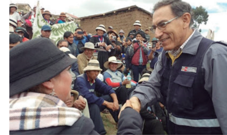
Vicepresidente Martín Vizcarra, durante su visita a Cotabambas

En declaraciones a la prensa del 8 de diciembre, Vizcarra reafirmó su convicción de que el plan de desarrollo presentado a la provincia de Cotabambas permitirá el crecimiento cualitativo de esta provincia apurimeña. Indicó que el Gobierno presentó