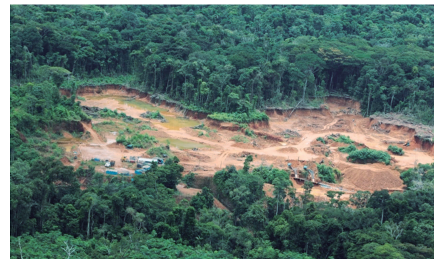
La minería en Madre de Dios utiliza áreas muy extensas, por cuanto los trabajos de explotación no se profundizan

Al respecto, sugirió que una alternativa de solución es propiciar un segundo uso para las áreas alteradas, por la minería, donde se puedan albergar especies que son interesantes para usarse industrialmente, ya sean pastos, caucho u otra forma de explotación forestal.