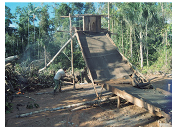
Instalaciones de Minería informal en Tambopata

Huaypetue es quizás el yacimiento minero, conocido, más grande del mundo. Se ubica en Madre de Dios, una extensa región de 8 millones de hectáreas (más grande que Costa Rica) la más despoblada del Perú, donde se produce, aproximadamente, el 9.2 % del oro del país. Esta región amazónica asociada -sin hacer un exhaustivo análisis de su complejidad- a la minería informal e ilegal, es para el ingeniero Oscar Frías Martinelli, la cornucopia de oro del Perú y debe ser pensada como un área estratégica de la nación. Ingeniero de minas, graduado en la Pontificia Universidad Católica del Perú, Frías cuenta con estudios en la Universidad Estatal de Pensilvania. Actualmente catedrático de su alma mater habla, como lo hace con sus alumnos, sin prejuicios, de los estigmas que se ciernen sobre la minería