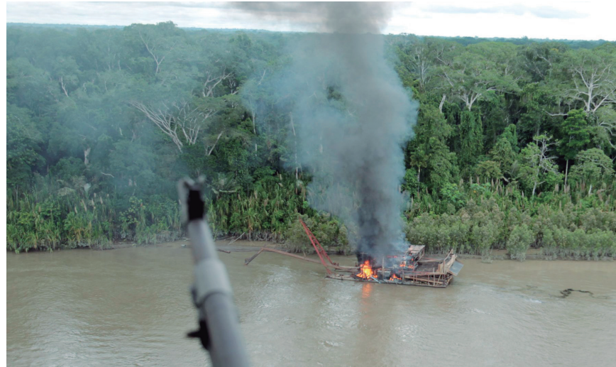
La destrucción de los bienes de capital de la minería informal ha sido infructuosa para erradicarla

Don Alberto Benavides de la Quintana, fundador de la minería moderna en el Perú, sostuvo que la minería informal sumaba alrededor de 400 mil pequeños productores y que cerca de un millón de personas dependían, indirectamente, de esta actividad que, en producción de oro y cobre, movía alrededor de 2,000 millones de dólares. Recordemos que al final del gobierno nacionalista la minería informal siguió extendiéndose en todo el territorio nacional. Se formalizaron apenas 400 de un universo de más de esos 400 mil mineros artesanales y se continuó depredando el medio ambiente.