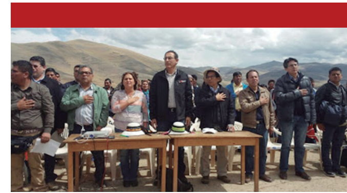
Las propuestas del vicepresidente Vizcarra, no han logrado todavía la aprobación de las autoridades locales por la desconfianza de la población.

de la cual esta actividad ejerce influencia”, indicó. Este proceso informativo resulta importante, toda vez que en la víspera, durante la reunión que Vizcarra y los representantes del gobierno central sostuvieron con los lugareños, inicialmente varios alcaldes “no estuvieron de acuerdo” con lo ofrecido, mayormente por una cuestión de desconfianza.