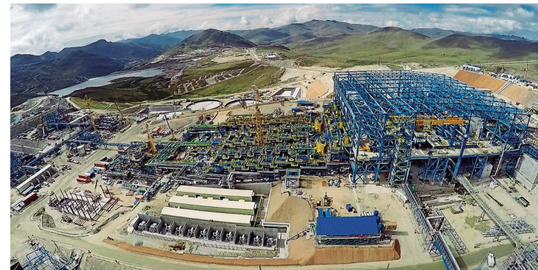
Vista Panorámica de las Instalaciones en las Bambas

Al respecto, mencionó que la mayoría de ellos son viables; pero que se hace necesario efectuar una programación y desarrollar un orden de prioridad, “porque todos no se pueden hacer a la vez”. Martín Vizcarra precisó que, entre los más urgentes están el asfaltado de la carretera por donde salen los camiones con el mineral, así como proyectos de saneamiento, debido a que en Cotabambas no tienen agua potable. Además, explicó que aún no se les pagó a los dueños de las tierras por donde se construyó dicha vía, al igual