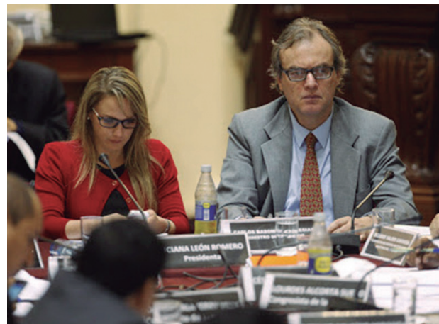
Ministro del Interior, Carlos Basombrio durante su presentación en el Congreso

la participación de la población en la discusión de los acuerdos fue masiva