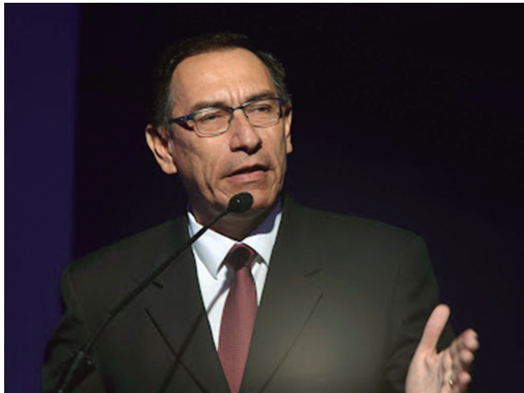
Primer Vicepresidente del Perú, Martín Vizcarra