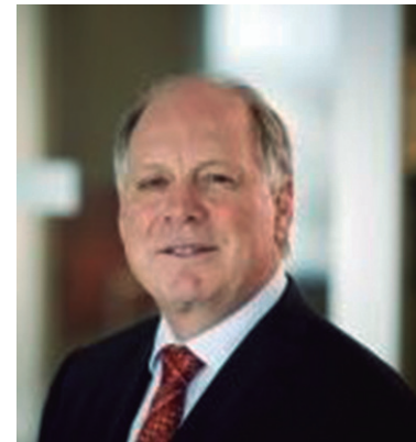
Andrew Milchmore, CEO de MMG Las Bambas

“Hay algunos problemas de infraestructura, inseguridad, hay protestas y tenemos que trabajar en eso, pero debemos apoyar también a la Policía que está a 4,400 metros y de repente no están bien apoyados o las instrucciones no son claras y deben serlo”, dijo.