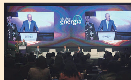
Presidente Kuczynski durante su presentación

El Presidente de la República se mostró muy optimista en relación al futuro del Perú en el ámbito de la energía, durante su participación en el “V día de la Energía”.