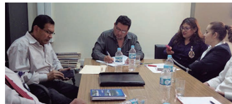
Viceministro y autoridades regionales durante la reunión.

El Viceministro de Desarrollo e Infraestructura Agraria y Riego, Jorge Montenegro, se reunió con autoridades regionales de Arequipa. Déficit hídrico es crítico. Gobierno nacional y regional comparten esfuerzos para superarlo.