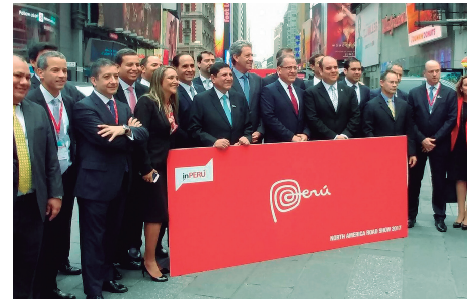
Delegación del Perú en el Road Show de InPerú, realizado en Toronto y Nueva York

El ministro de Economía y Finanzas, Alfredo Thorne señaló en Nueva York que el proyecto Michiquillay saldrá entre setiembre y octubre de este año.