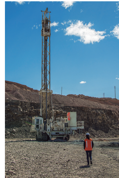
En el Perú las empresas mineras y sus contratistas disponen de excelentes equipos para la exploración

En ese marco, dijo que el Gobierno continuará reuniéndose con estas empresas para continuar fomentando la confianza y mantenerlas informadas sobre el potencial del Perú como país destino de inversiones en el sector. “Es importante que seamos consistentes en