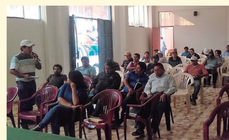
Mineros informales durante su capacitación en Arequipa

Al menos 1,400 mineros informales de Arequipa fueron capacitados entre marzo y mayo sobre el proceso de formalización minera por personal de la gerencia regional de Energía y Minas, entidad que busca lograr la plena formalización del sector en esa parte del país.