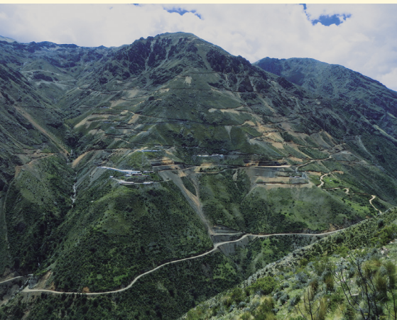
Vista panorámica del campamento de la mina Trapiche