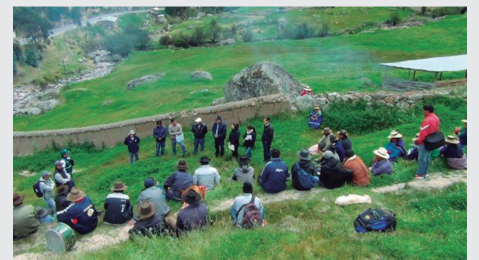
Representantes de la Comunidad de Huambo, que se beneficiarán con el mejoramiento del canal de Rinrin Pampa

Del mismo modo los representantes de Antamina, el PSI y de la empresa ejecutora manifestaron su satisfacción por el inicio inmediato del proyecto que tiene como finalidad mejorar la calidad de vida de los beneficiarios e instaron a todas las partes a contribuir en la ejecución del proyecto para su culminación según lo programado.