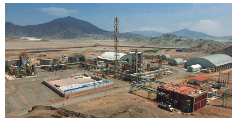
Procesadora Industrial Río Seco, donde se ha desarrollado un exitoso programa de innovación tecnológica

vas de cobre, mejorar el control del mineral para incrementar su recuperación y continuar con los estudios para la expansión del Tajo Norte (Smelter).