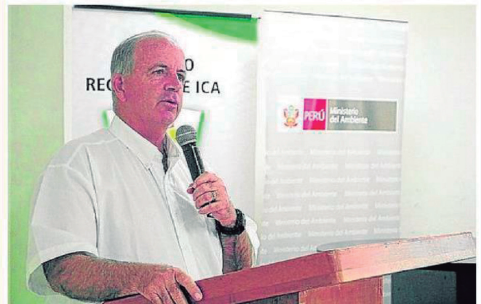
Retiran a exgerente que "era permisivo con la corrupción"