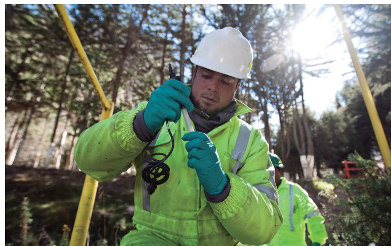
Monitoreo ambiental en Uchucchacua

Durante el primer trimestre del 2016 el precio de cada acción de Buenaventura alcanzó un mínimo de US$3.38 por ADR (American Depositary Receipt). Sin embargo, dicho precio se incrementó por encima de US$15, al segundo trimestre del mismo año, debido a la reducción de costos en todas sus unidades, la disciplina en gastos de capital y el incremento de producción en Cerro Verde. Así como también por la recuperación de los precios de los metales, que produce la empresa, en especial el oro, la plata y el zinc, y la permanencia de la Bolsa de Valores de Lima en el Índice MSCI (mercados emergentes). Sin duda, el 2016 fue un buen año para la compañía minera. Sin embargo, la pérdida de tres vidas humanas, reportadas como accidente fatales, puso so-