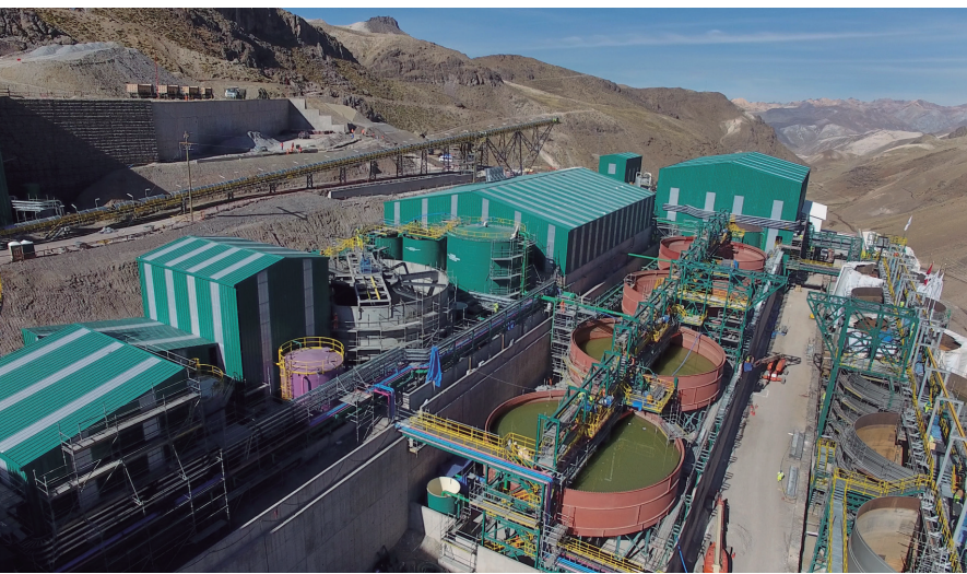
Unidad de Producción Tambomayo que inició operaciones en el 2016

Actualmente, el Perú cuenta con importantes proyectos de inversión cuya implementación se encuentra trabada por trámites o por conflictos sociales no atendidos en localidades con muy poca presencia estatal. El desarrollo de proyectos mineros requiere de atención, imaginación y coherencia para que su materialización sea productiva en términos competitivos y oportunos.